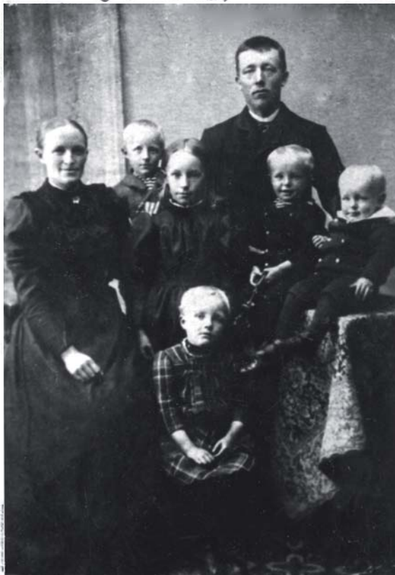
Det Billede fra 1894 1894