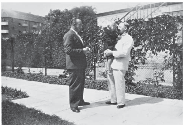
Kommunejunge No 1