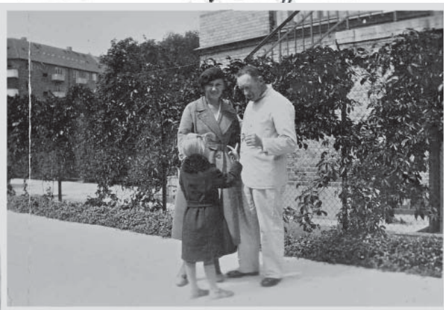
med Hone og Datter overst. Tante Dine dræffer som mer høj med Bodil & Vindde skostuunoi — At gang fra