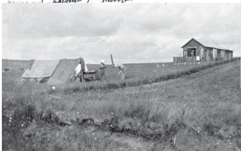
Sammelsletten ved Skoning (Parrisje) Lundsden Strømmes Tøllsmann.